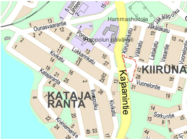
Kuva 2. Suunnittelualueen sijainti.

Osallistumis- ja arviointisuunnitelmassa (MRL 63 §) kuvataan kaavatyön tavoitteet ja lähtökohdat, valmistelun ja päätöksenteon eteneminen, kaavan vaikutusten arviointitavat sekä osallistumismahdollisuudet ja tiedottaminen. Osallistumis- ja arviointisuunnitelmaa päivitetään kaavatyön eri vaiheissa tarvittaessa.