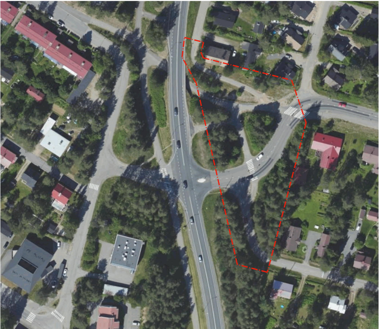
Kuva 1. Ilmakuva suunnittelualueesta, suunnittelualue rajattu punaisella katkoviivalla

ASEMAKAAVAN MUUTOS 4. KAUPUNGINOSA KATU- JA VIRKISTYSALUEET, POROKATU- VUONELONTIE