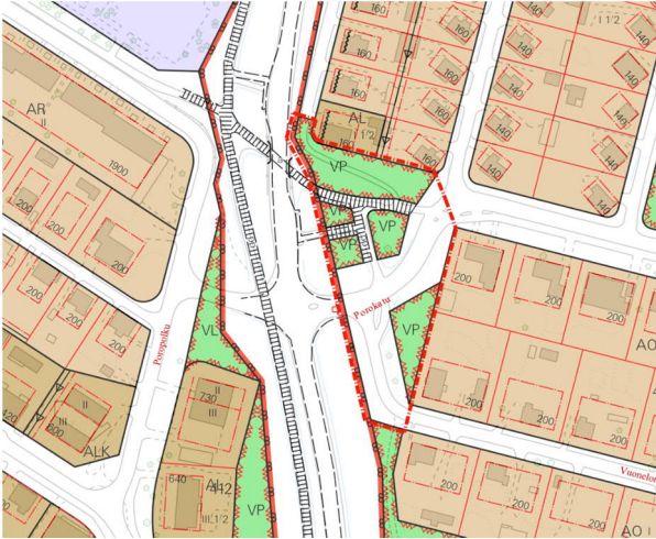
Kuva 4. Voimassa oleva asemakaava ja aluerajaus

Kajaanintien kehittäminen – aluevaraus-suunnitelma (ELY-keskus, 2018)